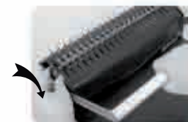
Мал. 5 Вставте та відкрийте пластикову пружину. Потягніть на себе ручку для розкриття пружини і встановіть замок у положення «Відкрито» (OPEN).