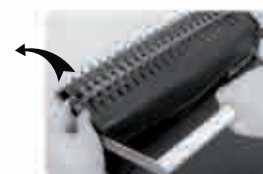
Мал. 7 Після закінчення, відкрийте замок і поверніть ручку в початкове положення.