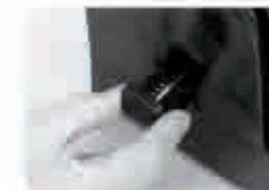
Мал. 2 Підготовка до перфорації: Потягніть ручку регулювання глибини перфорації для її регулювання від 2 до 5 мм