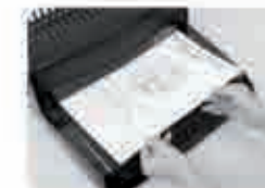
Мал. 3 Вставте папір (макс.12 листів 80 г/м за один раз в слот для паперу)