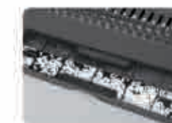
Мал. 9 Очистіть лоток від відпрацьованого матеріалу