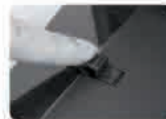
Мал. 1 Підготовка до перфорації. Прокрутіть колесо регулювання для налаштування формату паперу (A4/A5)

Примітка : Будь ласка , не вставляйте пластикову пружину до тих пір , доки не буде завершена перфорація паперу та обкладинок для буклету .