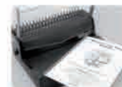
Мал. 8 Заберіть переплетений буклет