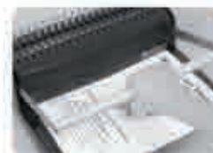
Мал. 4 Натисніть на ручку вниз, до завершення перфорації листів.