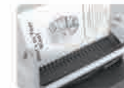
Мал. 6 Вставте перфоровані листи на розкритту пружину